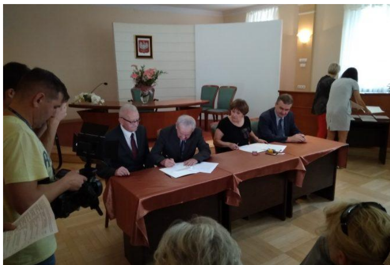
Fot. Uroczyste podpisanie umów na dotacje celowe dla kieleckich ogrodów działkowych, archiwum Urząd Miasta Kielce

Kieleccy seniorzy mają możliwość prowadzenia własnego ogródka w ponad 6600 rodzinnych ogródkach działkowych na obszarze Kielc. ROD w 2018 r. otrzymały z budżetu miasta 1 milion złotych na podniesienie stanu ogrodowej infrastruktury i tym samym komfortu użytkowania działek przez poszczególnych działkowców.