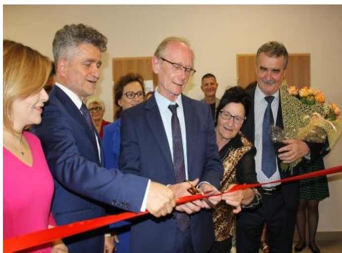
Otwarcie Domu Senior+ przy ul. Krzemionkowej